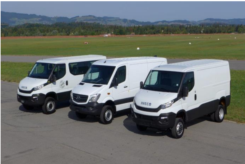
Achleitner Österreich / IVECO Schweiz / Mer- cedes Schweiz