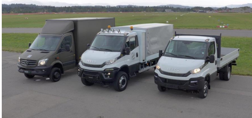
Achleitner IVECO 4x4 IVECO Daily 4x4 und Mercedes Sprinter 4x4